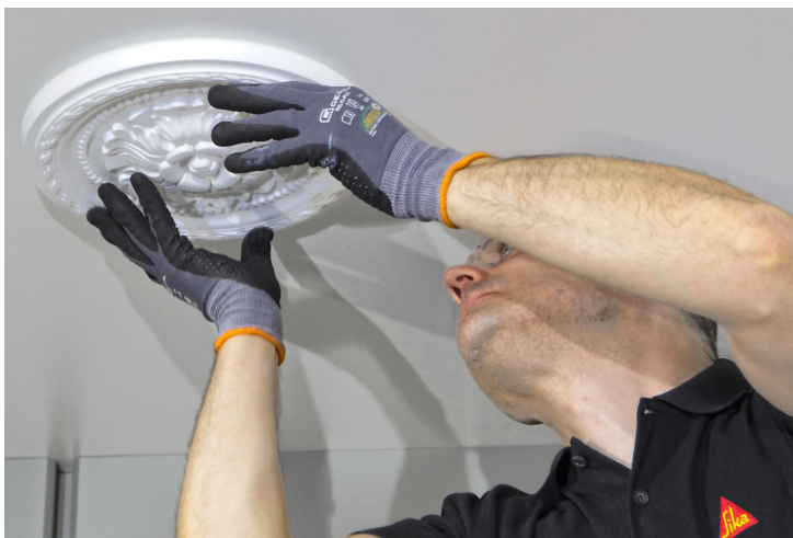
Beltéri dekorációs munkák.

Szegélylécek, fakeretek, díslécek, stukkók, fatáblák, terracotta lapok, eloxált alumínium, kemény PVC profilok, polisztirol díszítőelemek és álmennyezetek ragasztásához