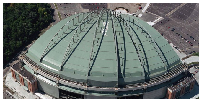
Miller Ball Park, USA