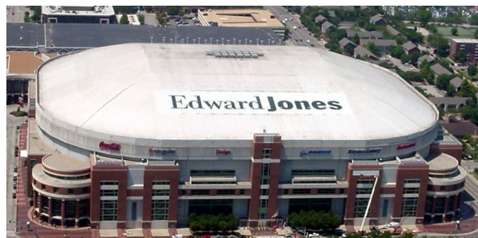
Edward Jones Arena, USA