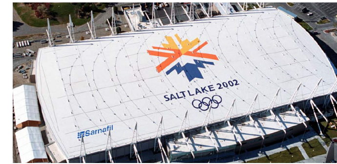
Salt Lake City, USA