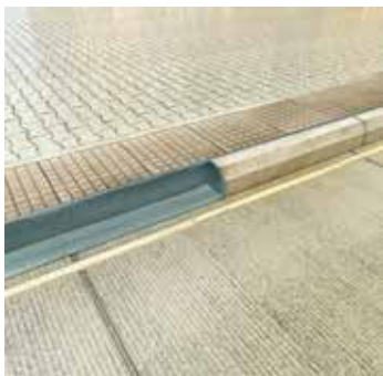
Kő és beton ragasztása.