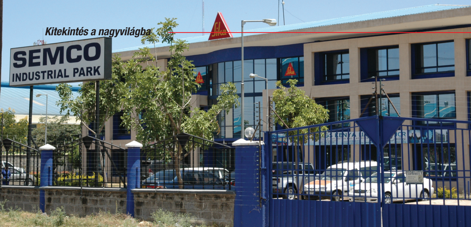
A Sika cégcsoport Nairobiában, Kenyában

“Mi a helyzet Afrikában?”, folytatás a 8. oldalról