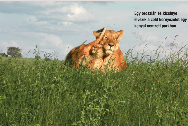
Egy oroszlán és kicsinye élvezik a zöld környezetet egy kenyai nemzeti parkban