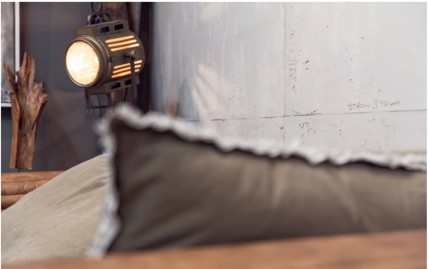
A SikaWall® lenyűgöz gyönyörű megjelenésével, természetes betonszínével és pórusképzésével.