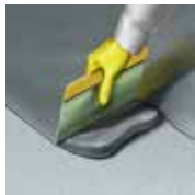
1 - 2 x alapozóréteg