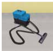
Portalanítás ipari porszívóval