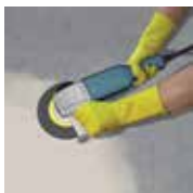
Érdesítés, laza részek eltávolítása, tisztítás