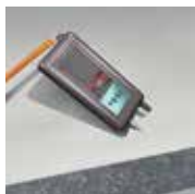
Nedvességtartalom és nyomószilárdság mérése*