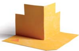
SCHÖNOX ST EA külső sarokelem