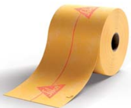
SCHÖNOX ST hajlaterősítő szalag