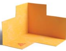
SCHÖNOX ST IC belső sarokelem